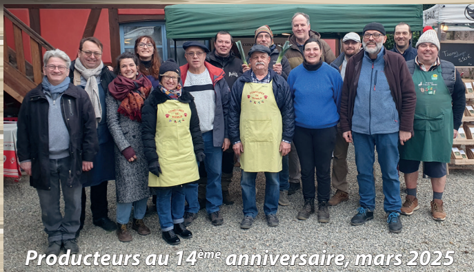
Producteurs au 14 ème anniversaire, mars 2025