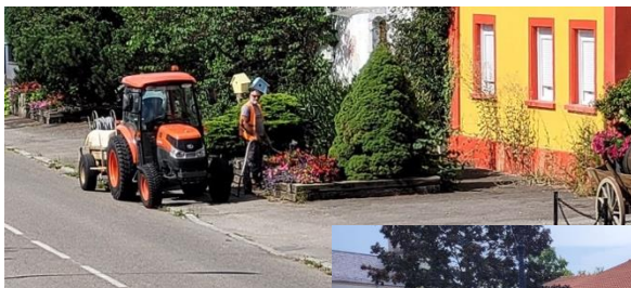
Entretien des espaces verts