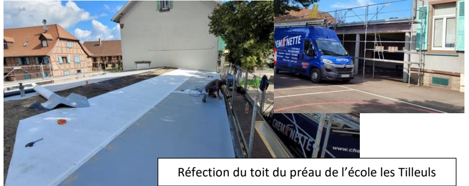
Réfection du toit du préau de l'école les Tilleuls