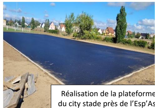
Réalisation de la plateforme du city stade près de l'Esp'Ass