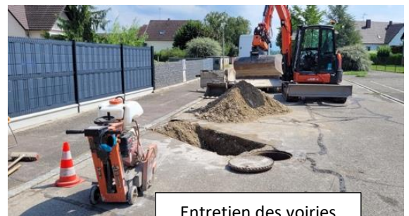
Entretien des voiries