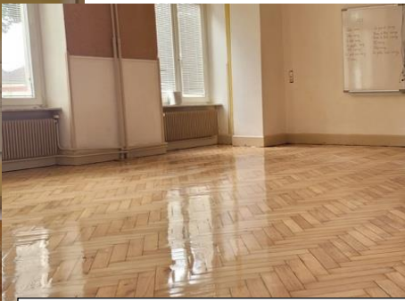
Travaux d'entretien de l'école les Tilleuls