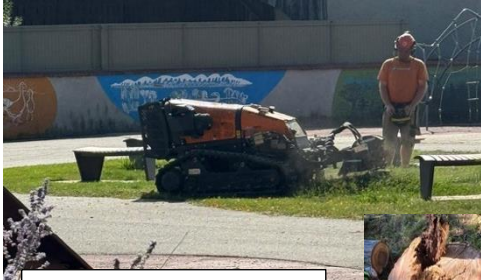
Dessouchage des arbres morts de la cour de l'école les Tilleuls avant remplacement