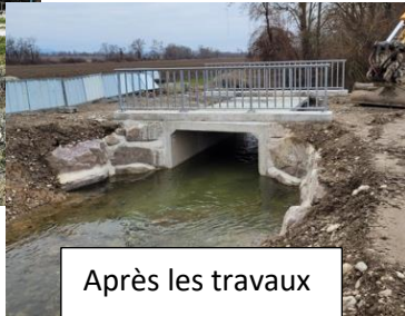
Après les travaux