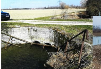
Avant les travaux