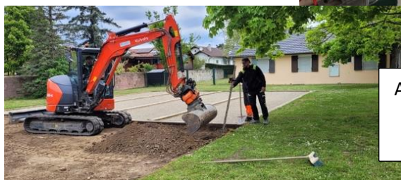
Agrandissement du terrain de pétanque

La population de Blodelsheim est conviée à la