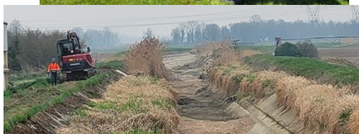
Travaux d'étanchéité du canal de la Hardt